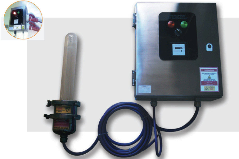
Equipo Esterilizador U.V. 150 Lts.

EQUIPOS GERMICIDAS PARA EL CONTROL DE CONTAMINANTES MICROBIOLÓGICOS